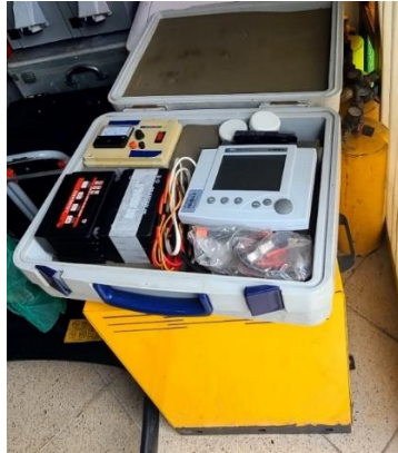
Foto multiparamétrico IQ SENSOR NET 184X con todos sus componentes.

Activo fijo ubicado en el parque de las aguas – abril 18 de 2023