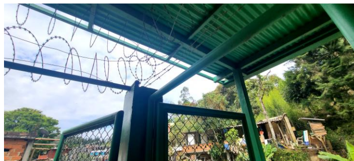
Elementos de protección de la estación monitoreo, día 12 de abril de 2023