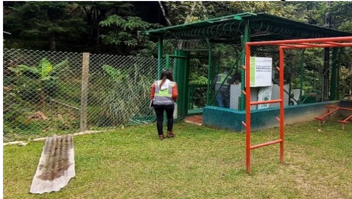
Estación monitoreo predio de la acción comunal, día 12 de abril de 2023