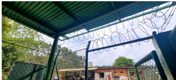
Elementos de protección de la estación monitoreo, día 12 de abril de 2023